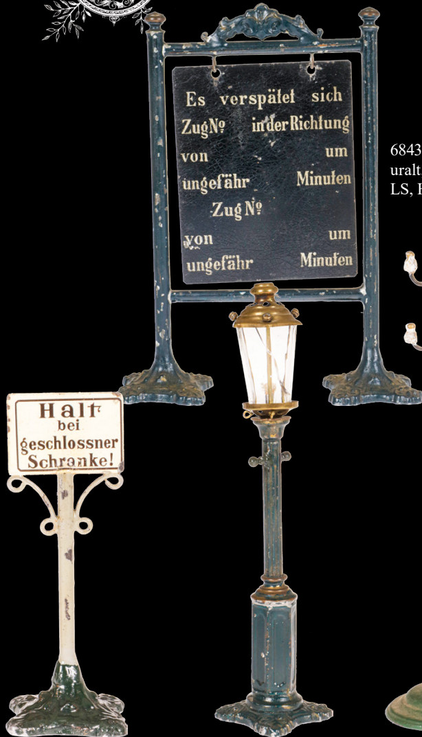
6843 Rock & Graner Verspätungstafel, uralt, handlackiert, Alterungsspuren, kleine LS, H 18, noch Z 2 300,- €