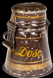
6826 Rock & Graner Spardose, uralt, handlackiert, Aufschrift „Spar=Dose“, H 9, Z 2 50,- €