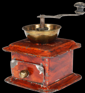
6832 Rock & Graner Kaffeemühle, mit Schubfach und Handkurbel, uralt, HL, L 6, Alterungsspuren, Z 2 50,- €