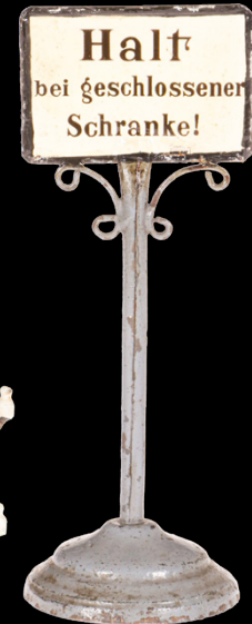
6844 Rock & Graner Schild „Halt bei geschlossener Schranke!“, uralt, handlackiert, kleine LS, H 15, Z 2 150,- €