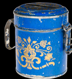
6827 Rock & Graner Spardose mit Henkel, uralt, handlackiert, tw LS, H 6,5, Z 2 50,- €