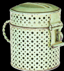
6829 Rock & Graner Henkel-Spardose, Lochblech, uralt, handlackiert, H 6, Z 2 50,- €