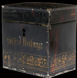
6824 Rock & Graner Spardose, uralt, handlackiert, Aufschrift „Spare fleißig“. L 7, Z 2 50,- €