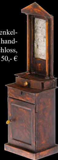
6833 Rock & Graner Puppenmöbel, Spiegelschränken, mit Tür und Schubfach, uralt, HL, im Biedermeier-Stil, H 17, Z 2 100,- €