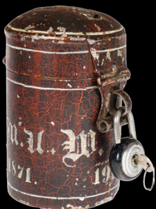
6828 Rock & Graner Spardose, uralt, handlackiert, verschiedene Datierungen, 1818, 1871, 1912 und 1941, mit Vorhängeschloss und Schlüssel, tw LS, H 9, noch Z 2 50,- €