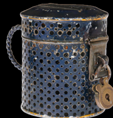
6830 Rock & Graner Henkel-Spardose, Lochblech, uralt, handlackiert, mit Vorhängeschloss, H 6, Z 2 50,- €