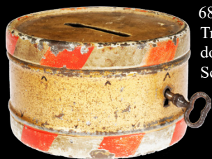
6831 Rock & Graner Trommel als Spardose, uralt, HL, mit Schlüssel, Durchmesser 7,5, noch Z 2 50,- €