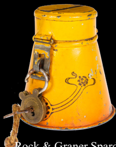
6825 Rock & Graner Spardose, uralt, handlackiert, Jugendstil-Motiv, mit Vorhängeschloss und Schlüssel, H 8, Z 2 50,- €